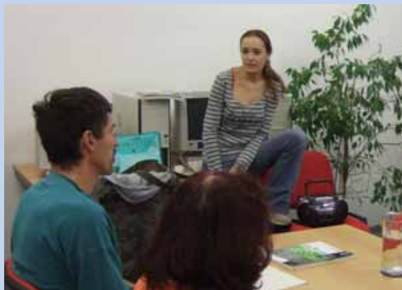
Kurz anglického jazyka pokročilí